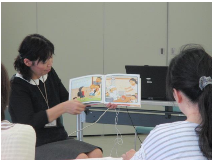
受講されたみなさんの様子

保健師から『小児看護の基礎知識』について講義 子どもの心身の発達等についてお話をいただきました。