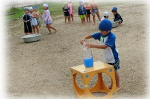
満水リレーでは、色の変化を楽しんだり、容器の大きさで水の入り方がちがうと気づく子もいました。