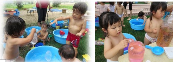
小さい組は、ナイロン袋に水を入れてポチャンと水の中に落としたり、氷を浮かべたりして楽しんでいます。