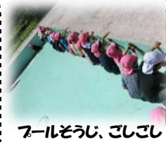
プールそうじ、ごしごし

7/1は、と〜っても暑い日でしたが、プール遊びを楽しみに一生懸命たわしでプールそうじをがんばりました。少しの間入れましたが、暑い日が続く、水不足となりプールでの遊びは中止となりました。色水ごっこをしたり、さかなつりごっこをしたり・・・。まだまだ、いっぱいいろいろな遊びを楽しんでいます。その中で、子どもたちはいろいろな発見をしたり、驚いたり・・・。