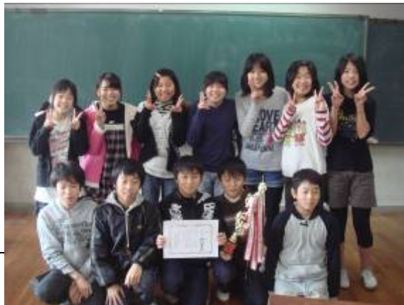
5・6年生の部優勝チーム