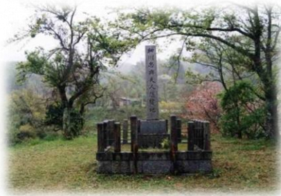
細川ガラシャ夫人隠棲地 (女城跡)