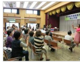
みんなでタイ舞踊も体験