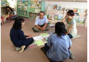
エピソードに沿って、ゆっくりゆったりお話を。