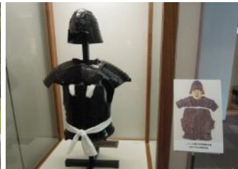
ニゴレ古墳から出土した鉄鎧(古代の里資料館)