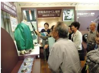
税関の役割を学び、密輸捜査の体験もしました。税関は広くて綺麗でした。ハイチーズ！