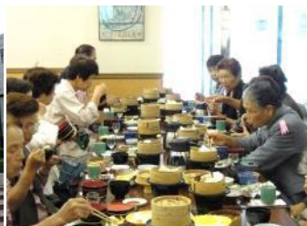
ヤクルトの製造過程や効用について学習しました。