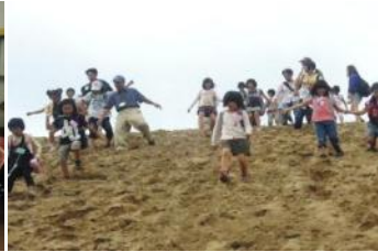
鳥取砂丘はとても広かったね。下りはダッシュ！