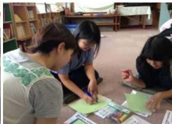
自己紹介カードの記入。子育てで楽しかった事は？