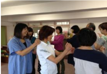
今回は網野幼稚園でおしゃべり会をしました。