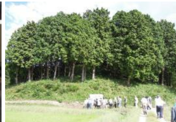
黒部銚子山古墳。墳長100mの前方後円墳。