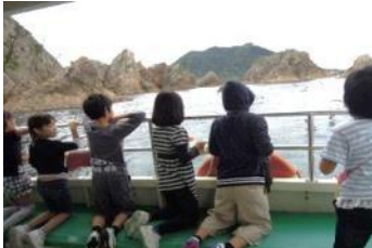
浦富海岸の遊覧船で、ウミネコに餌やりタイム☆