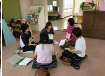
子育て支援チームの方が話のサポートをしてくださいました。