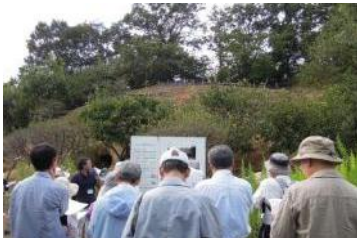
ニゴレ古墳。古墳時代中期の不整形墳。