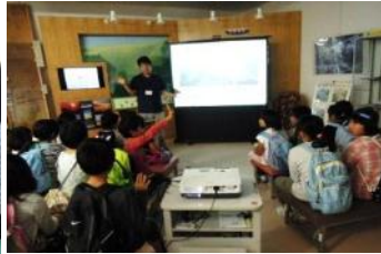
鳥取砂丘ジオパークセンターで砂丘の学習をしました。