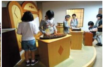
わらべ館では世界のおもちゃと楽器とを体験しました。