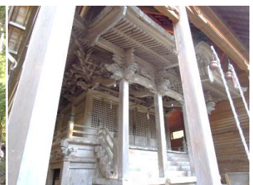
福昌寺ご住職にお話しを伺いました。稀にみる大きな室町時代の十三仏石塔 深田部神社の府指定無形民俗文化財「しかか踊り」は子供達に伝わる大切な文化遺産