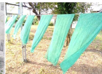
藍(タデアイ)の生葉を摘みとり、ミキサーにかけ、染液をつくります。シルクのストールを浸し干せば・・・少し緑がかった藍色がとても綺麗です。