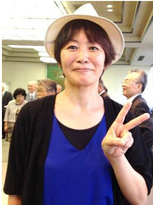
京都文教大学臨床心理学部 教育福祉心理学科 講師