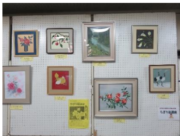
ちぎり絵講座作品