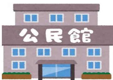
【峰山地域公民館の職員】