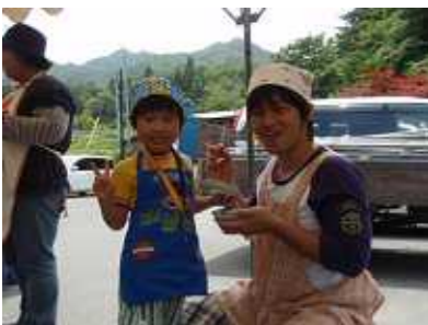
出来上がったこんにゃくを、さしみこんにゃくにして、いただきました。