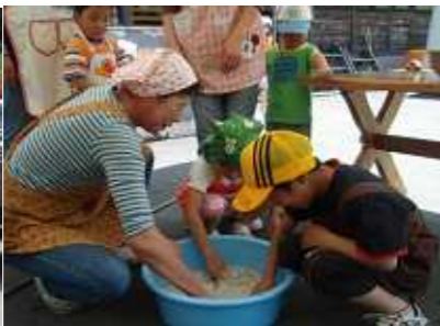
ミキサーにかけたこんにゃく芋を、子どもたちみんなで練りました。

六月一日(日)に「親と子のふるさと教室」春編」を実施しました。「ふるさとの春を求めて」をテーマに今回は、奥山自然たいけん村「茶屋あそび石」を会場に、こんにゃく芋からこんにゃくづくりに挑戦しました。汗ばむような天候の下、初めて体験するこんにゃくづくりに参加した8組の親子は熱心に取り組みました。