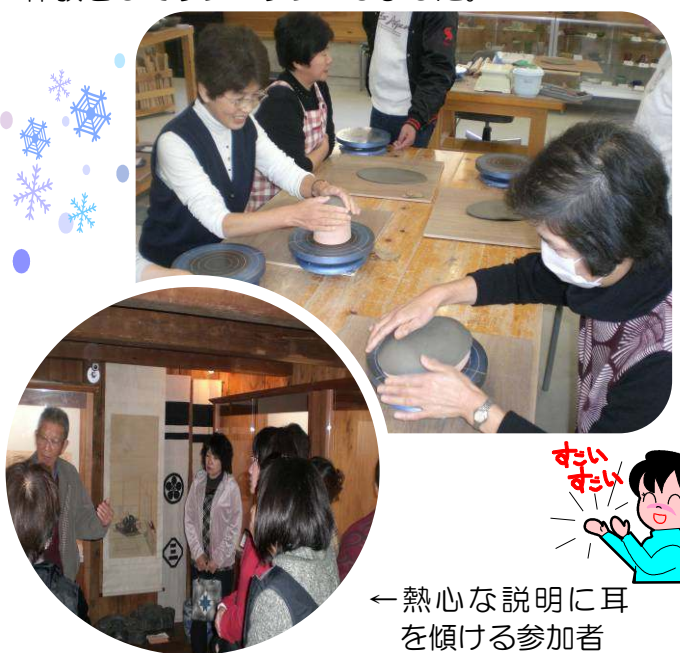
←オリジナル作品に挑戦です

釉薬をつけて焼く仕上げの作業は、工房職員の方をお願いして出来上がりを楽しみに帰ってきました。半日の駆け足学習でしたが、日頃できない体験をしてリフレッシュしました。