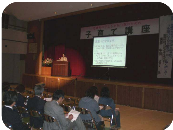
↑ すぐに実践できる内容で勉強になりました

参加者からは、「子どもの表情や言葉で、気持ちを読み取るということが、すごく大事なんだということがよく分かりました。」「能動的な聞き方というすばらしい聞き方があるのだと、びっくりしました。くりかえす、言いかえる、気持ちをくむ、の3つを頭におきながら、子どもと話そうと思います。」などの感想が寄せられました。