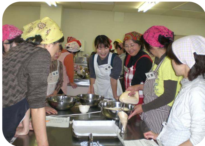
↑ 先生!意外と簡単にできるんですね～