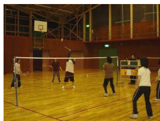
↑ ファミリーバドミントン