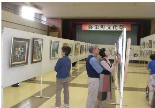
↑ 皆さんに見てもらえるのが励みです