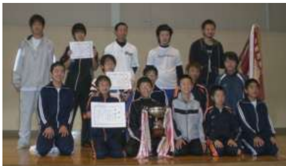
2年連続8回目の優勝を飾った黒部チーム