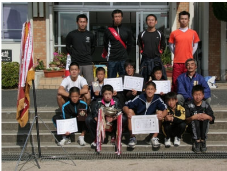
十年ぶりの優勝を飾った 溝谷チーム