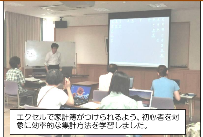
エクセルでかんたん集計講座 7/11～8/8(全5回)

エクセルで家計簿がつけられるよう、初心者を対象に効率的な集計方法を学習しました。