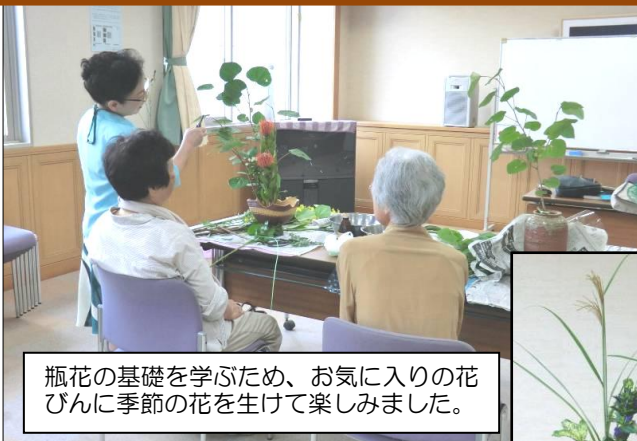
手持ちの花びんに生ける花講座 7/13・9/14(全2回)

エクセルで家計簿がつけられるよう、初心者を対象に効率的な集計方法を学習しました。