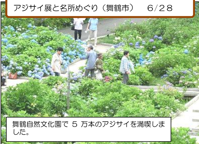
アジサイ展と名所めぐり(舞鶴市) 6/28