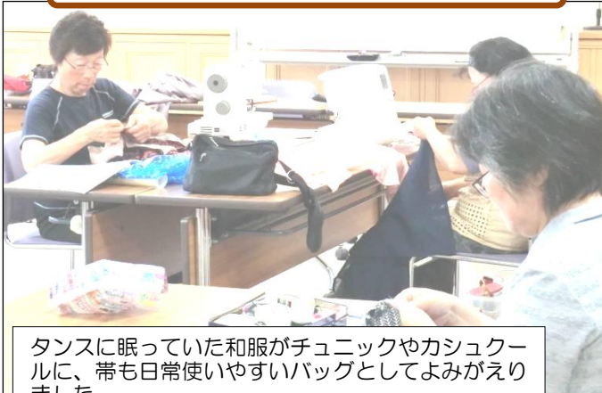
和服リフォーム講座 6/5～7/3(全5回)

タンスに眠っていた和服がチュニックやカシュクールに、帯も日常使いやすいバッグとしてよみがえりました。