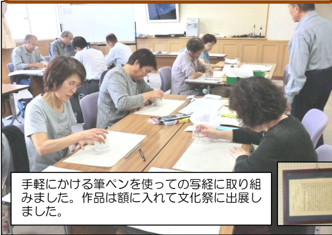
筆ペンで書く写経講座 9/25～10/30(全5回)

手軽にかける筆ペンを使っての写経に取り組みました。作品は額に入れて文化祭に出展しました。