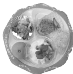
料理を選んでバランスプレートに