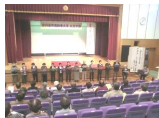
多目的ホールで発表