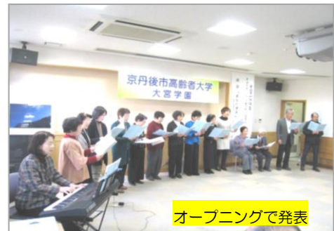
オープニングで発表