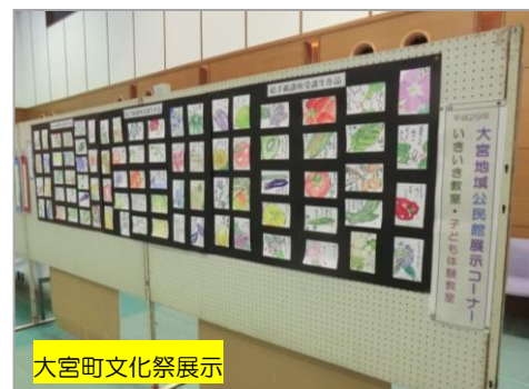
大宮町文化祭展示