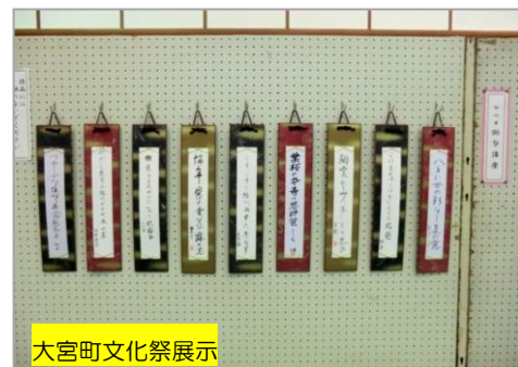
大宮町文化祭展示