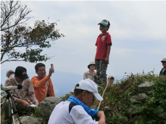
▲ 大声コンテスト、お腹に「力」と「思い」を込めて!!