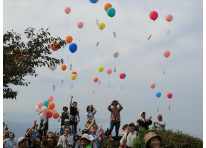
▲ みんなの夢を乗せた風船は、はるか旅をし、栃木県芳賀郡茂木市の方の所に届いたそうです。その距離なんと直線距離にして461km!!