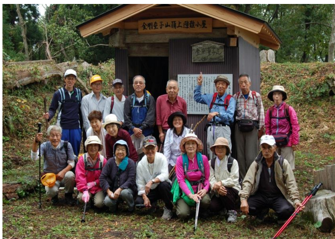
【金剛童子山頂上で記念写真】

10月5日（土）、丹後町上山の上山寺から修行僧がたどる道が古くから開かれていたとされる 弥栄町の金剛童子山（613m）へのトレッキングを実施しました。