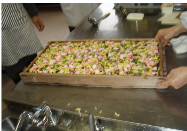
【美味しそうなばら寿司が完成】

今回の『男の料理教室』は、3回シリーズで開催されます。2回目は巻きずしを、3回目はいなり寿司に挑戦します。