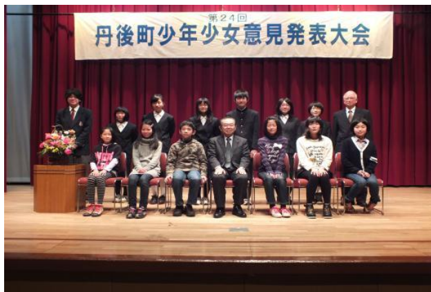
▲がんばってくれたみんなに拍手！