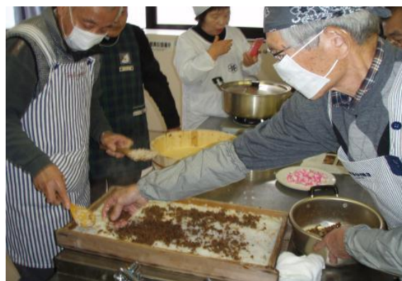
【ばら寿司作りに挑戦】

あまり家庭で包丁を握ることの少ないお父さん方は、材料を切るだけで一苦勞。中にはびっくりするほど、上手なお父さんもおられました