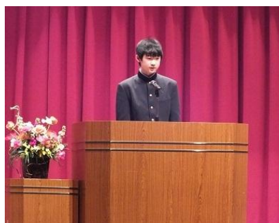
▲中学生の部 発表の様子