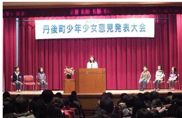
▲発表風景/自分たちの思いや意見を堂々と発表しました