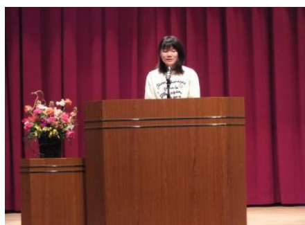
▲小学生の部 発表の様子