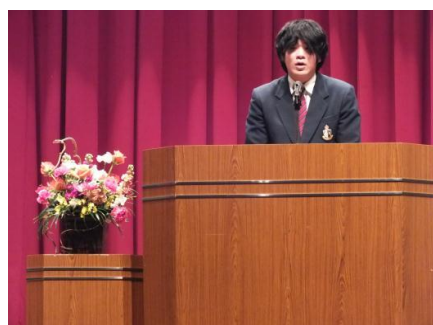
▲ゲスト発表者の蛭子さん