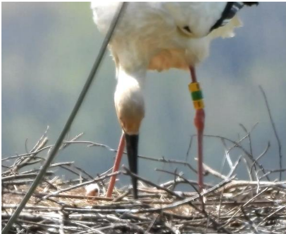
令和3年4月6日9:52 メス親 (J0053) とヒナ1羽