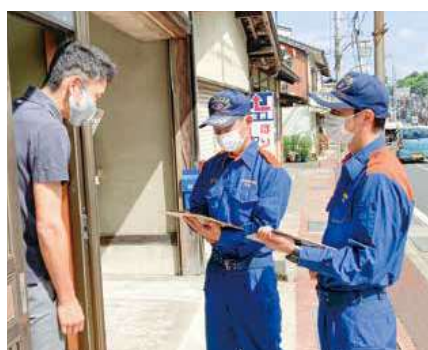
住宅用火災警報器促進の訪問の様子

なぜ、全世帯訪問? 住宅用火災警報器は、新築住居は平成18年6月から、既存住宅は平成23年5月31日までに設置することが市火災条例で義務付けられています。消防本部は設置促進に取り組んできましたが、全世帯への設置には至っていない状況です。そこで、令和3年〜令和7年の5年間で全世帯への訪問を行い、設置促進の強化を行うこととしました。 この訪問を通して、「住宅用火災警報器の「条例適合率(※)引き上げ」と「設置済み世帯の定期的な作動確認および電池寿命約10年の注意喚起」を行います。 ※寝室が1階の場合は台所・寝室に設置、寝室が2階の場合は台所・寝室・階段に設置している割合。