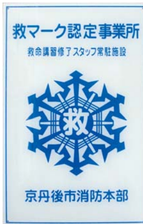
《救マークプレート》

■救マーク認定事業所 広い面積を持つ京丹後市では、救急車が現場に到着するまでに時間を要するケースもあり、そのような場合、現場に居合わせたかたの応急手当がとても重要です。 市では、平成十八年十一月から上級救命講習の修了者のかたが常駐する旅館や大型店舗などに「救マークプレート」を交付する「救マーク認定制度」をはじめました。その施設の数、今年度で六十三施設となり、たいへん心強いものです。 今後この制度を広め、維持し、安全で安心して暮らせる京丹後市をめざします。 なお、「救マーク認定事業所」については、京丹後市消防本部のホームページで公開しています。 《平成十九年度救マーク認定事業所》 ㈱日進製作所 本社工場 ㈱タンゴ技研 ホテルつかさ峰山 プラザホテル吉翠苑 ㈱大宮日進 ㈱タング技研 本社センタービル 別館 浜乃屋 ㈱まつや えいざぶろう健康院 はまづめ荘 ㈱友善 旅亭 海山