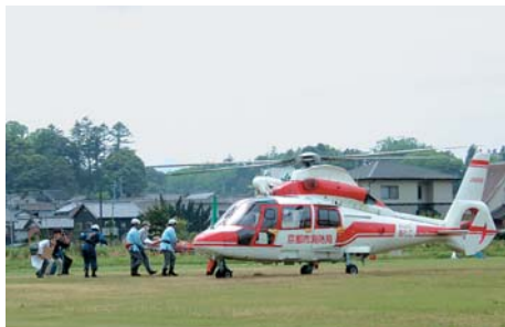
*ヘリコプターによる救急搬送訓練

■救急搬送体制 消防は病気やケガをされたかたをその症状を悪化させることなく病院まで運ぶことが第一の役目です。 救急救命士も現在十三人体制となり、その処置範囲と内容も数年前と比べ、広くなり高度化が進んでいます。 消防署では、この救急の高度化に遅れることなく日々、研修、訓練しているところ。周辺の医療機関と連携をとりながら、みなさんにとって少しでも「救命のリレー」がより効率的で効果のあるものになるよう努めてまいりますので、今後ともご理解とご協力をお願いいたします。