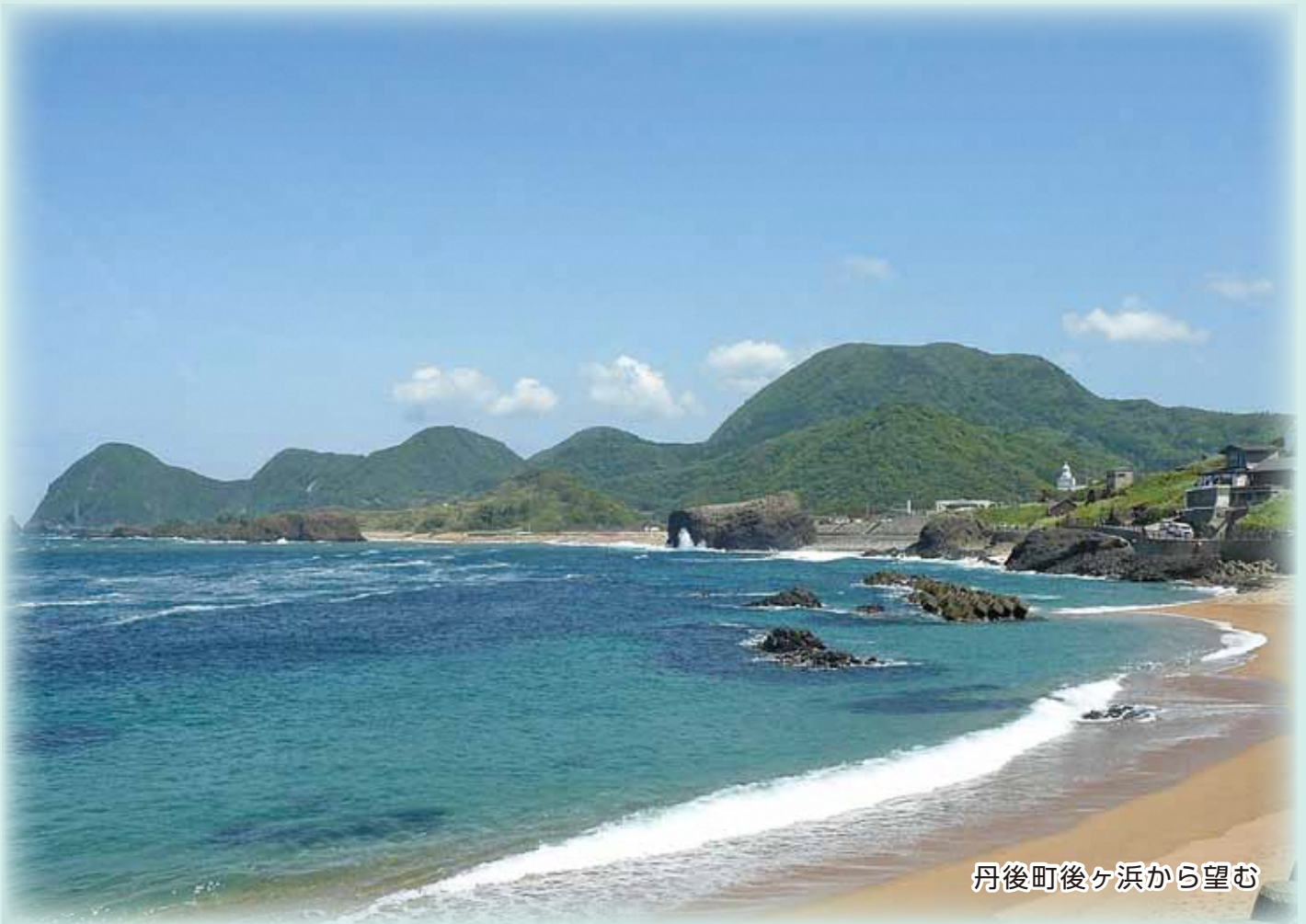
丹後町後ヶ浜から望む