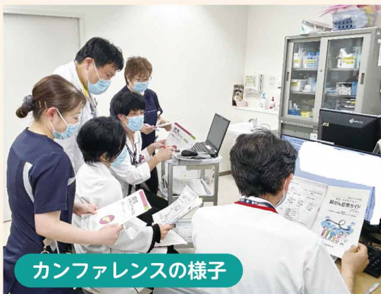
カンファレンスの様子