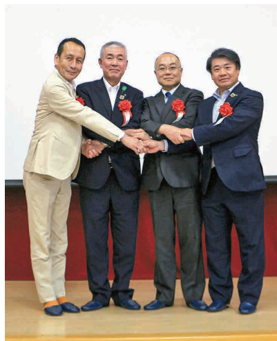
▲塚原町長 中山市長 両病院長握手