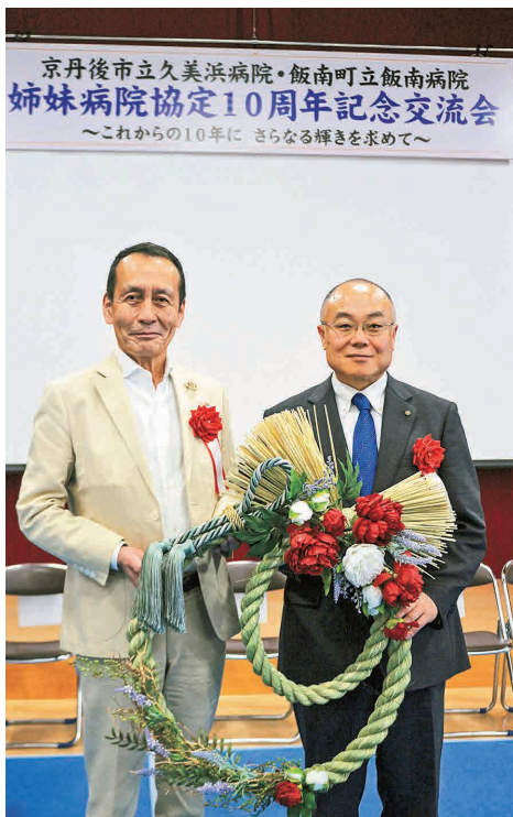
▲赤木病院長と中山市長