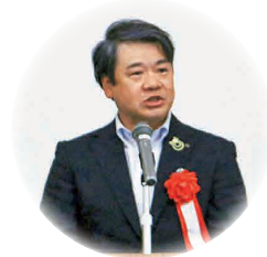
▲角田病院長ご挨拶