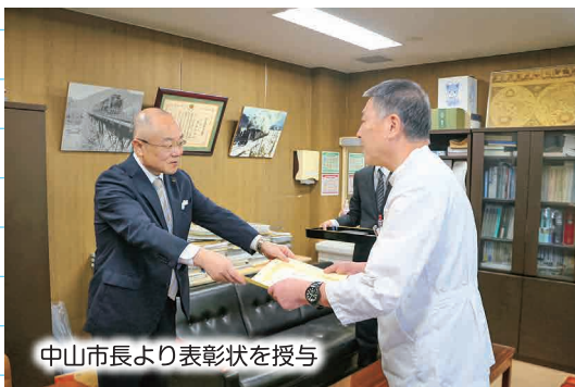
中山市長より表彰状を授与