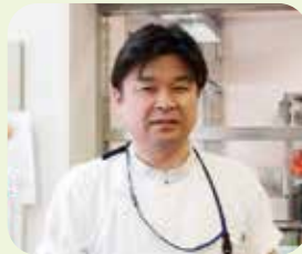
理学療法士・作業療法士・歯科衛生士