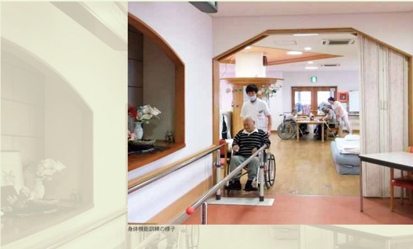
身体機能訓練の様子