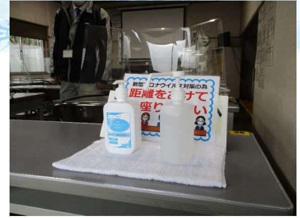
万全な新型コロナウイルス感染症対策のもとでの講習