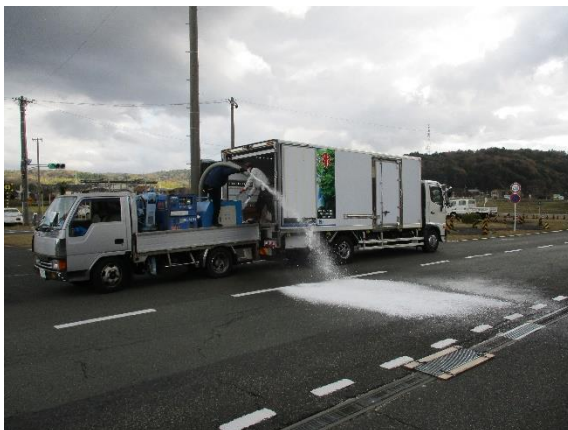
人工降雪機による積雪路の再現