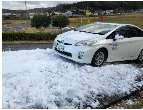
積雪路面におけるスリップ体験