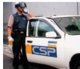
車両での巡回警備