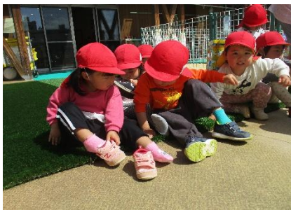
友達を見て真似をして自分で靴を履こうとしています。