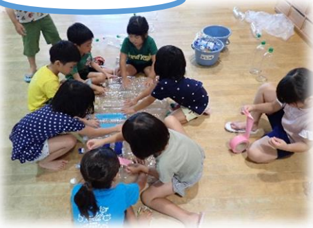
友達と協力してペットボトルをつなぎます

5歳児は、プール遊びを楽しむ中で『船をつくりたい』『どうしたら浮くかな』『ペットボトルがたくさんいるからお願いしよう』と友達と考え、試行錯誤してつくり『やったー！浮かんた！』と大成功！友達と楽しむ協同性が育まれました。