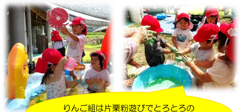
りんご組は片栗粉遊びでとろとろの 感触も楽しめました！