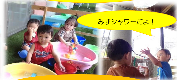
みずシャワーだよ！