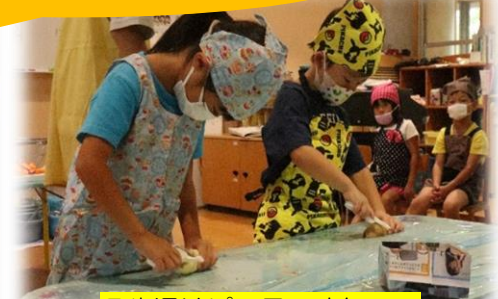
5歳児はピーラーや包丁で 真剣にクッキング