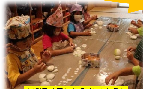
4歳児は目にしみにないように 玉ねぎちぎり！