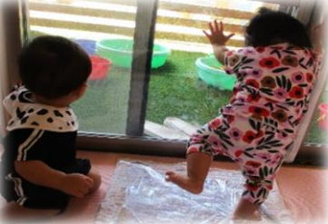
0・1歳児はウォータークッションがぶにぶにして大喜び♪