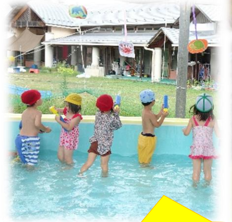
的あて水鉄砲やウォーターライダー でプールカーニバルを楽しみました♪