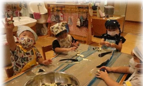
3歳児はナスやピーマンをちぎったよ