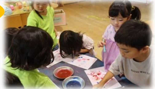
4歳児はコンテを使ってお絵かき いろいろな表現を楽しみます