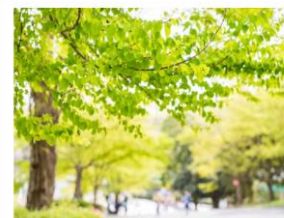
環境に優しいまち