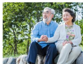
高齢者に安心のまち