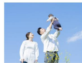
交流を生み出すまち