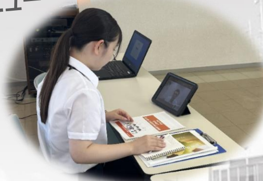
気になる仕事を インタビュー