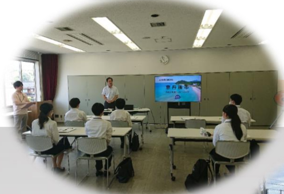
オリエンテーション