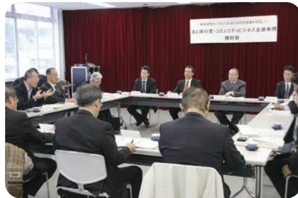
水と緑の里・コミュニティビジネス検討会の様子