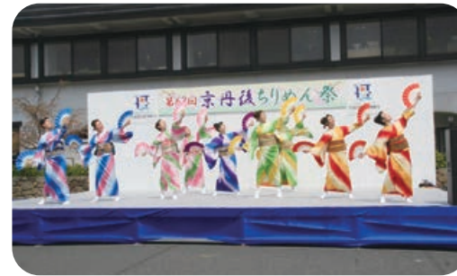
丹後ちりめんPR～丹後小町踊り子隊～