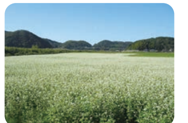
そば畑（丹後町岩木）

そばの栽培による地域産物の育成及び耕作放棄地解消を図り、「京都そば」(仮称)としてブランド産地化することを目指し、実証研究・先進地視察等に着手します。