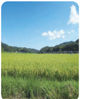
団地化された特別栽培米

特別栽培米 ▶ 地域の慣行レベルに比べて、農薬の使用回数が50%以下、化学肥料の窒素成分量が50%以下で栽培されたお米。