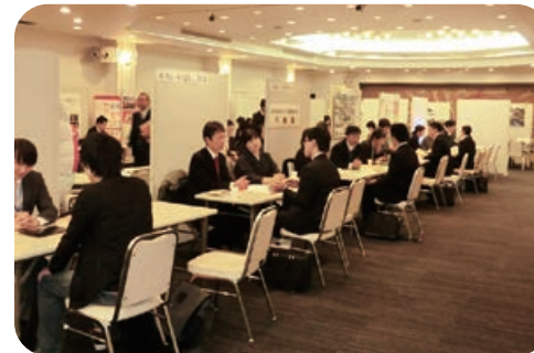
昨年の「ふるさと就職フェアin丹後」の様子

一般求職者、大学等を来春卒業する予定の者やU・Iターン希望者などと、人材を求める地元事業者が会する「就職フェア」を開催し、地元への就職を促進します。また、U・Iターンによる人材を確保しようとする地元事業者に対して、市外合同説明会等への参加や都市部のU・Iターン希望者を招いて行う自社説明会、インターンシップの費用の一部を支援します。