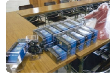
自主防災補助金を活用し購入した防災資機材