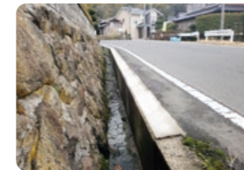
修繕を行った道路側溝

地区要望の実現のため、小規模で簡易な修繕等について、地域と市民局が協働で事業を実施します。カーブミラーやガードレール、防護柵等の修繕や、道路・側溝の補修、碎石や山土などの材料支給、タイヤショベル、キャリアなどの機械の借上げを支援します。