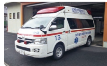
高規格救急自動車

病気や災害等、緊急対応に欠かすことのできない高規格救急自動車(峰山消防署竹野川分遣所)を更新し、市民の皆さんの安全・安心確保に努めます。