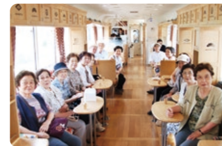
高齢者による鉄道利用

京都丹後鉄道の利用促進を図るため宮津市、伊根町、与謝野町と連携し、市内高齢者(65歳以上)を対象とした片道200円レールを実施します。高齢者の外出機会を増やし、健康づくりに寄与します。