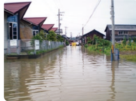
豪雨による浸水(網野町浅茂川)

網野町浅茂川地区の内水処理対策として、ポンプ場の建設工事を進めます。また、網野町網野地区における内水処理対策工事に着手するために必要な申請手続きをします。