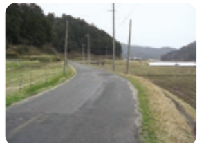
拡幅改良工事を予定している栃谷口馬地線(久美浜町三谷)