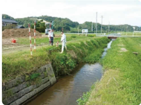
護岸の修繕工事を予定している入山川(弥栄町吉沢)