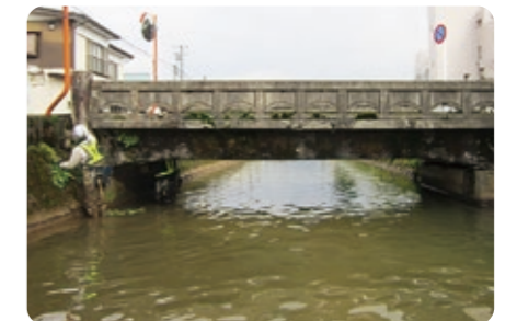
橋梁点検を実施した樋田橋(峰山町杉谷)