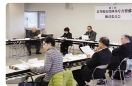
市役所本庁舎整備検討委員会の様子

「京丹後市役所本庁舎機能集約化基本方針」に基づき、更なる市民の利便性及び行政運営の効率性の向上に向け、本庁機能の集約化と本庁舎の整備について、具体的に検討を進めます。