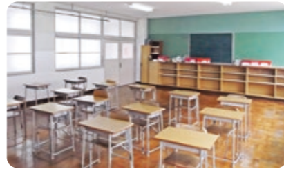
空調設備を導入する普通教室

大宮中学校、網野中学校、丹後中学校、弥栄中学校において、夏季の学習環境を改善するため、普通教室等に空調設備を整備します。