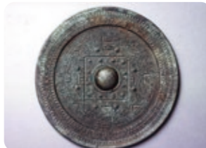
重要文化財に指定されている青龍3年銘銅鏡

○会期：平成27年12月5日～平成28年1月17日 ○会場：京都文化博物館(京都市)