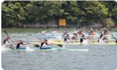
久美浜湾でのカヌー競技大会の様子

○開催日：平成27年8月4日(火)～8月8日(土) (5日間) 久美浜湾カヌー競技場