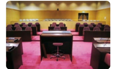
京丹後市議場の風景

交付額は一人当たり年額18万円以内とし、政務活動終了後の実績に応じた後払いや、領収書等関係書類の公開など、透明性の確保に努めます。