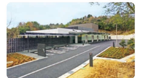
京丹後市火葬場(峰山町赤坂)