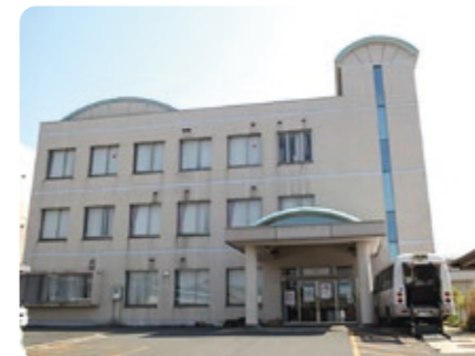
移転先の弥栄保健福祉センター

弥栄保健福祉センターふれあいの一部を弥栄庁舎として使用するため、庁舎の機器等を移転します。