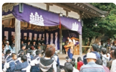
大宮売神社三番叟