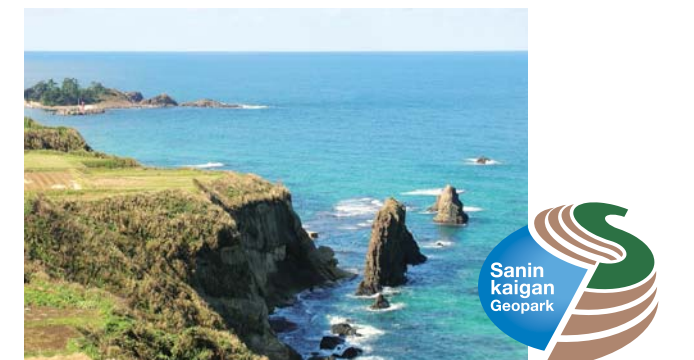
屏風岩(丹後町筆石)

山陰海岸ジオパークの世界認定による観光交流人口の増加をめざし、市内に拠点施設を設置(道の駅てんきてんき丹後内)するとともに、観光ガイドの養成、サイン整備、展示パネル作成など、さまざまな取り組みを積極的に展開します。