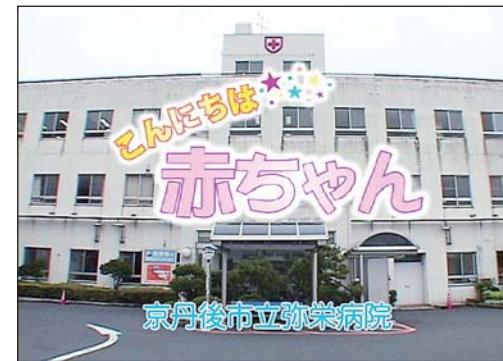
市立病院で生まれた赤ちゃんを紹介する番組など、地域情報満載の番組制作に取り組みます。

平成21年12月に開局したCATV(ケーブルテレビ)の自主放送チャンネルで、市の情報などを放送する「市政だより」の番組制作や市議会本会議の生中継を委託し、放送します。