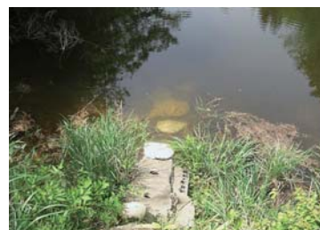
老朽化したため池

ため池の機能回復と永続性を確保し、農業生産性の向上と農業経営の安定を図るとともに地域防災に資するため、老朽化した危険ため池の整備を行います。(期間:平成19~22年度)