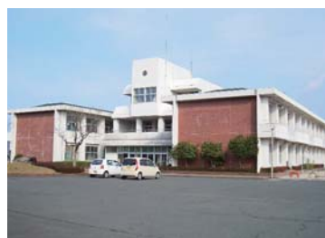
耐震診断実施予定の鳥取小学校