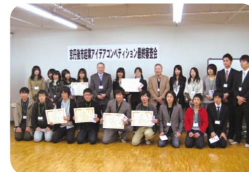
起業アイデアコンペティション

連携・協力に関する包括協定を締結している京都芸繊維大学をはじめ、京都府立大学、京都府立医科大学、京都産業大学、京都ノートルダム女子大学の学生を対象に、京丹後市の地域資源(自然、文化、生産物など)と学生の英知を融合させた斬新な起業アイデアを募集します。民間団体のご協力も得ながら、産業界と大学・市とが連携してコンペを行い、優秀なアイデアを表彰します。また、これまでに入賞したアイデアの事業化についても進めていきます。