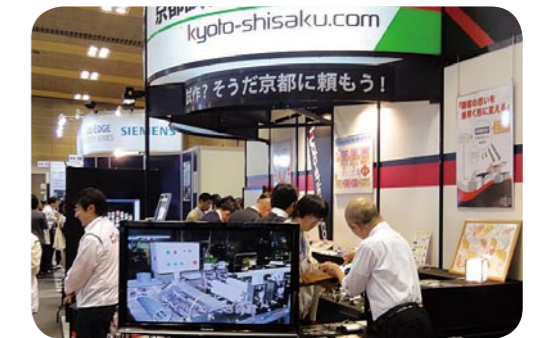
展示商談会への出展・対外活動の強化

新分野への進出・既存事業の拡大・新事業連携の構築のため、今後の成長分野をターゲットとした展示商談・販路開拓など対外活動の展開を進め、企業力の向上を図ります。