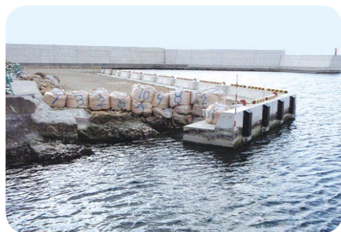
整備がすすむ浜詰漁港夕日泊地

平成14年度から10か年事業で、網野町浜詰漁港を整備しています。漁業者が安心安全に漁業活動を行えるように、防波堤や物揚場などを建設するとともに、生けすを利用した中間育成や出荷調整を行い、消費者のみなさんに新鮮な魚介類を提供することをめざしています。最終年度となる今年度は、物揚場、臨港道路、護岸および漁具保管修理施設などを整備します。(全体計画：平成14年度～平成23年度、総事業費10億6,500万円)