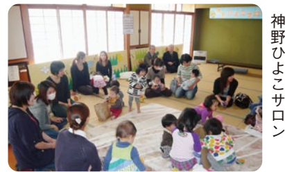
神野ひよこサロン

現在活動している連携組織は、久美浜町の神野地域里力再生協議会(5集落)、弥栄町の溪里野間(10集落)の2組織です。※今年度は新たに2組織を公募する予定です。