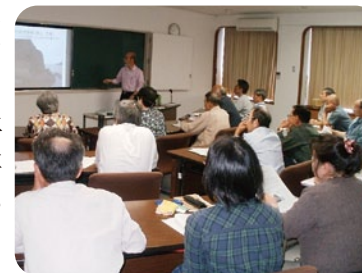
人材育成セミナー

■企業・工場誘致フェアへの出展経費 【商工費】(継続) 146万円 (商工観光部 産業雇用総合振興課)