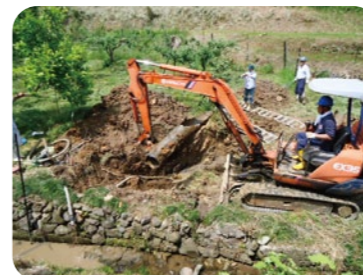
石綿管撤去の様子