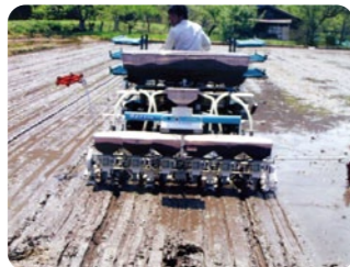
認定農家による作業風景

地域農業の基幹的担い手である認定農業者の育成および確保のため、経営確立や経営規模拡大の支援をします。