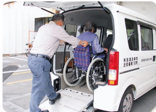
スロープ付き車両での通院の様子

また、市民税非課税世帯の高齢者等の利用料を減免している福祉有償運送事業者に対し、減免に要した経費の助成も行っています。