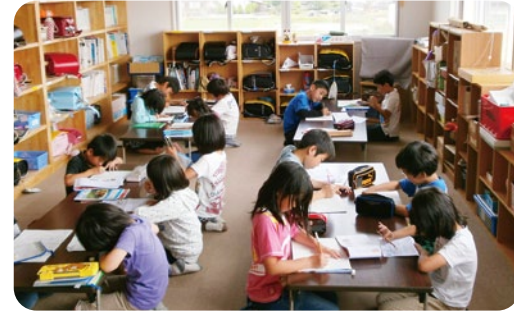
放課後児童クラブの子どもたち

保護者の就労などにより、学校の放課後や土曜日、長期休業中（夏休み、冬休み、春休み）に家庭での保育に欠ける小学校 1 年生から 4 年生の児童を対象に、日常生活や遊びの場を提供する放課後児童クラブを市内 11 か所で開設します。