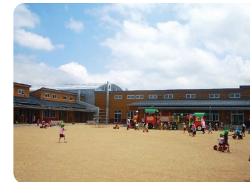
新設した大宮北保育所

今年度は、新たに大宮北保育所内に開設したことにより、市内の子育て支援センターは 7 か所となりました。育児相談をはじめ、保育所入所前のお子さん同士のふれあいや保護者の方の交流の場を提供するなど、地域の子育てを支援します。