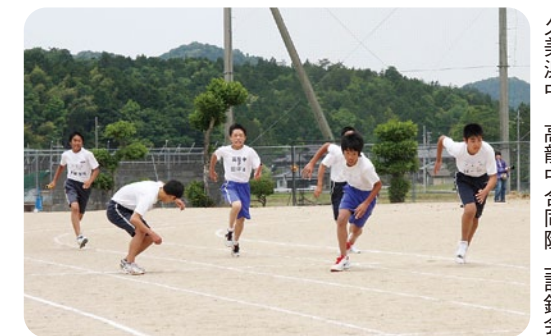
久美浜中・高龍中合同陸上記録会

再配置する学校の枠組みごとに「(仮称)学校づくり準備協議会」を設置し、新しい学校づくりの検討や学校の開校に向けた子どもたちの交流学习の実施、閉校・開校に伴う式典など、学校や地域の取り組みを支援します。