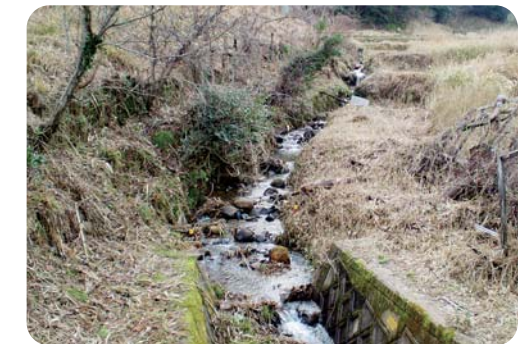
整備予定の家の奥川(久美浜町)