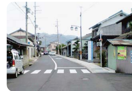
道路改良中の口大野姫御前線(大宮町)