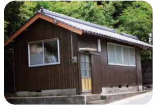
島津口集会所屋根改修

地区が所有される施設・設備の整備や修繕、村おこし地域づくり活動、緊急を要する事業など地域の課題に迅速に対応するため、市民局単位で補助金を交付します。