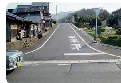
工区の拡幅改良が完了した郷新田岡線(網野町)