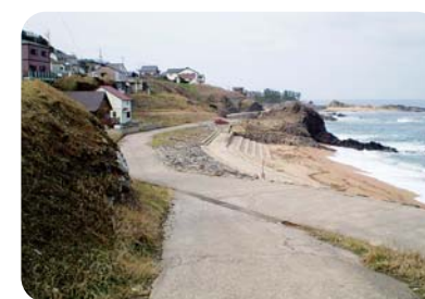
市道後ヶ浜海岸線(丹後町)