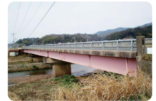
昭和50年に架けられた鳥取橋(弥栄町)