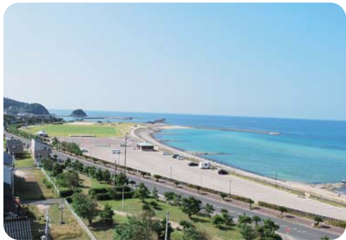
八丁浜シーサイドパーク (網野町浅茂川・小浜)

地方公共団体などの公共的団体に限定していた公の施設の管理・運営を、株式会社をはじめとした営利企業・財団法人・NPO法人・市民グループなど法人その他の団体に行わせることができる制度です。