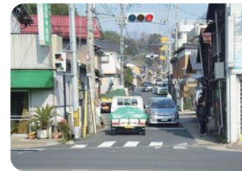
拡幅改良予定の下ノ割堂ゴヤ線(峰山町)