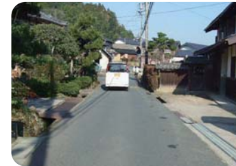
拡幅改良予定の向町土居後線(久美浜町)