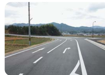
拡幅改工事中の左坂線(大宮町)

※国の社会資本整備総合交付金を活用して道路新設改良工事を実施します。 峰山町…安小西線 大宮町…左坂線、千丈敷下沖線、田井垣線 網野町…郷新田岡線、内ヶ森西池新田線(浅茂川橋改築) 丹後町…大門橋本線 久美浜町…蒲井旭線、神崎南浜線 ・無電柱化事業(網野町浜詰)