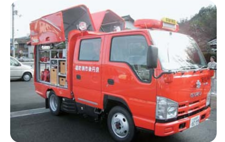
多機能型消防自動車