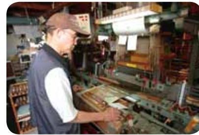
織物事業者の経営を支援

織機用ダイレクトジャカードコントローラー装置帯などの織物を織るジャカード織機の紋紙データを再生する装置。