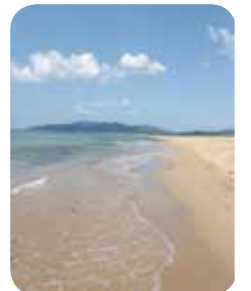
北近畿一のロングビーチ(小天橋～浜詰海岸)