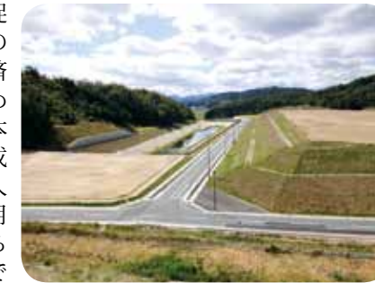
企業立地が望まれる森本工業団地

若者の定住促進と新規雇用の創出、地域経済の活性化のため整備された森本工業団地の造成事業に伴う借入金の償還費用を一般会計から繰り出すものです。