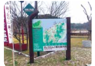
平成24年度に整備した観光サイン

平成23年度に策定した第2次観光サイン整備計画に基づき、形状・色彩等の統一を図ったサインの新設、既存看板の改修、撤去等を進め、観光客などに対する利便性の向上と本市のイメージアップを図ります。