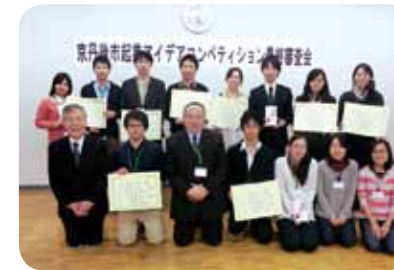
平成24年度起業アイデアコンペティション最終審査会

「連携・協力に関する包括協定」を締結している京都市芸繊維大学をはじめ、京都府立大学、京都府立医科大学、京都産業大学、京都ノートルダム女子大学の学生を対象に、京丹後市の地域資源(自然、文化、生産物など)と学生の英知を融合させた斬新な起業アイデアを募集し、優秀なアイデアを表彰します。また、これまでに入賞したアイデアの事業化を進めていきます。