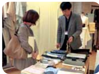
首都圏での販路開拓活動