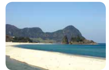
高嶋海水浴場(丹後町)

京丹後市の美しい砂浜・海岸の環境保全と活用を図り、年中にぎわう日本一の浜辺づくりに向けた取り組みを推進するため、日本一の砂浜海岸づくり実行推進会議を開催します。