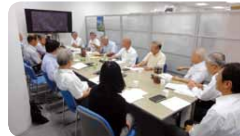
マッチングコーディネーター会議の様子

販路、調達・加工先、技術提携先などとのマッチングを行い、機械金属産業における事業分野の拡大と経営基盤強化を推進します。